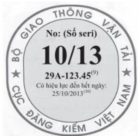
Tem kiểm định cho xe cơ giới